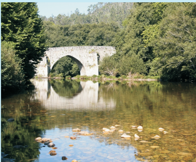
Río Tea e ponte Cernadela, comezo e fin da ruta

COMO CHEGAR: desde Mondariz cóllese a estrada a Covelo e o desvío a O Ceo e Cernadela. Tamén se pode ir pola outra beira do río por Riofrío.