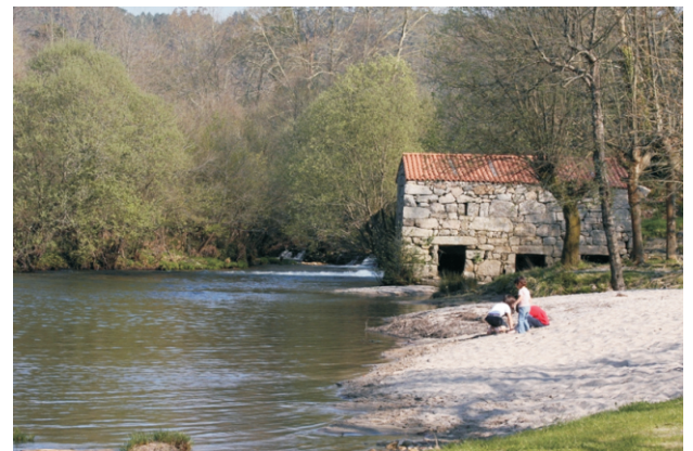
Praia fluvial e muíño

Unha ruta circular nun tramo do río Tea en terras de Mondariz. Para gozar da paisaxe, da natureza, da arte (ponte medieval de Cernadela) e a etnografía (pasais, muíños, e presas), nun tramo no que o río forma remasos de augas craras onde podemos atopar numerosos paxaros, anfibios e insectos.