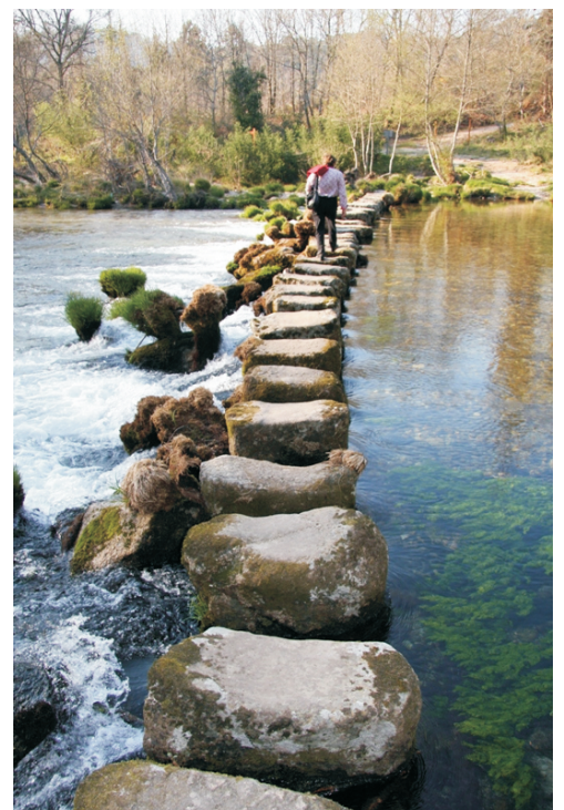
Pasal de Tatín